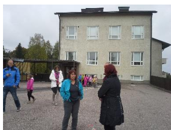
Dve šolski stavbi, ločeni druga od druge