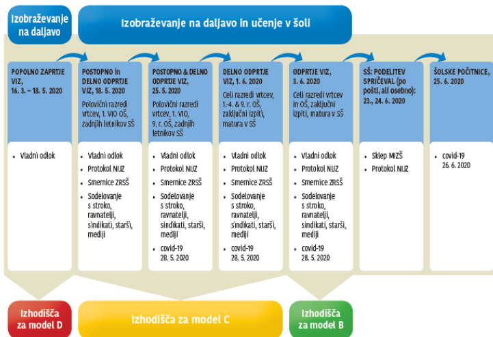
Slika 1: Ukrepi in izobraževanje v času epidemije covid-19 9